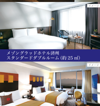
メゾングラッドホテル濟州 スタンダードダブルルーム(約25㎡)