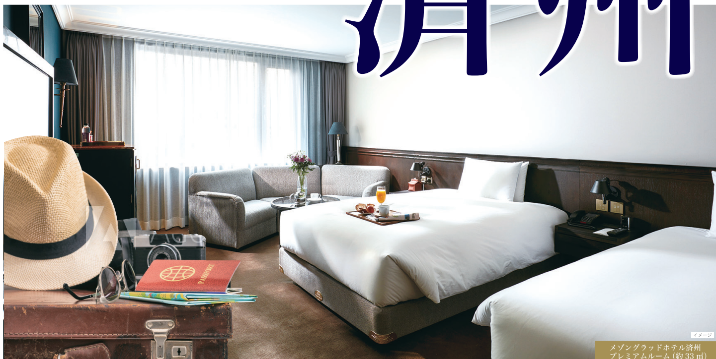
メゾングラッドホテル濟州 プレミアムルーム(約33㎡)