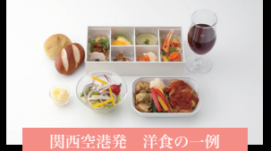
関西空港発 洋食の一例