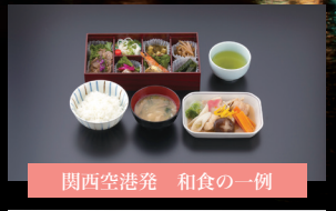
関西空港発 和食の一例