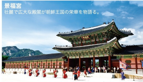
景福宮 壮麗で広大な殿閣が朝鮮王国の栄華を物語る。

小麦粉で作られた平麺を使った温かい麺料理。辛くなくあっさりした味で辛いのが苦手な方にもGOOD!