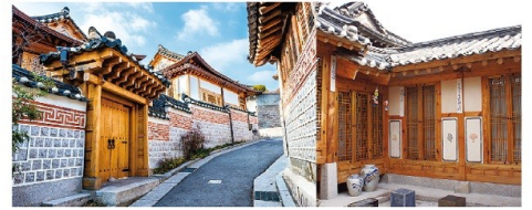
北村韓屋村 伝統韓屋から、最近建てられた真新しい韓屋まで、時代別の韓屋が並ぶエリア。現代のなかフェヤやショップも立ち並びます。